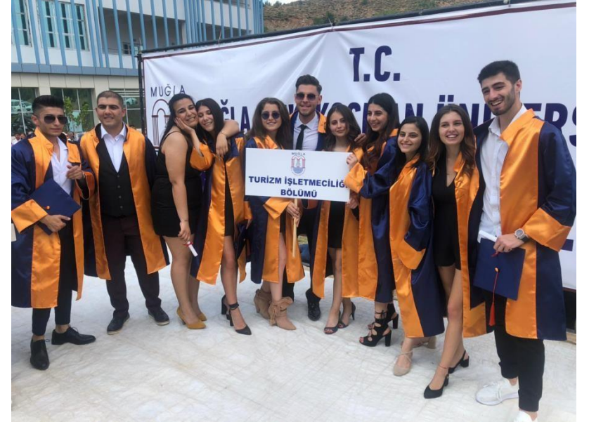
Turizm İşletmeciliği Bölümü Tanıtımı