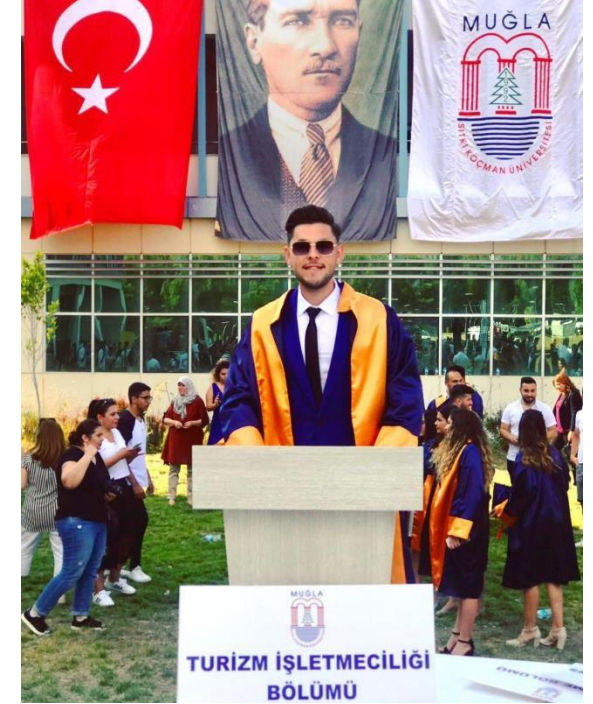
Turizm İşletmeciliği Bölümü Tanıtımı